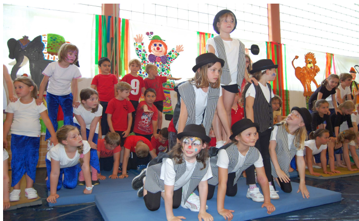
Zirkusprojektwoche 2013 mit Aufführung beim abschließenden großen Schulfest