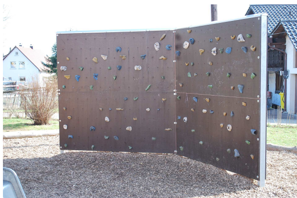
Die Kletterwand wurde 2010 realisiert